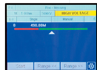
Mess-/Bewertungszeit 55 ms inkl. IO-/NIO-Anzeige